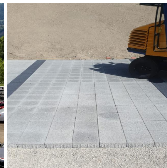
Pose des pavés à la machine et sablage des joints