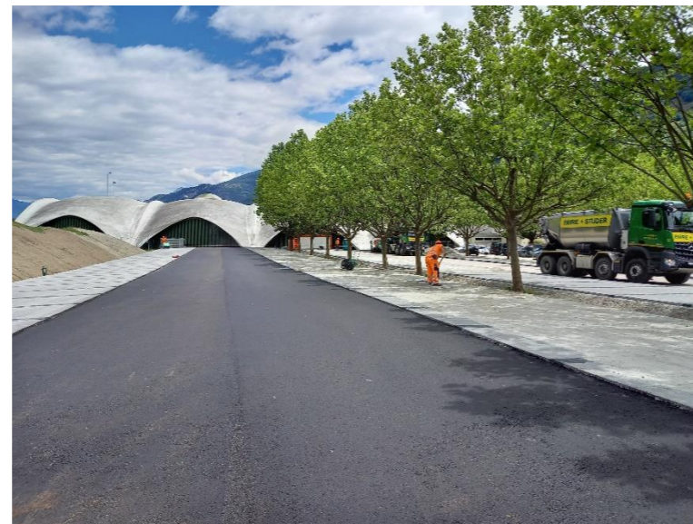
État fini après pose des enrobés bitumineux