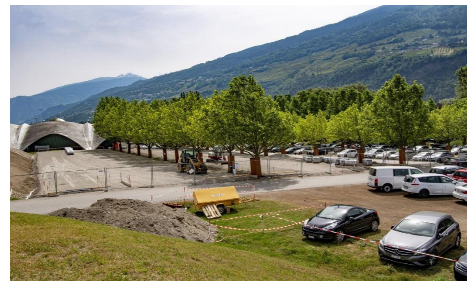
Exécution du lit de gravillon de réglage 4/8 pour zones pavées