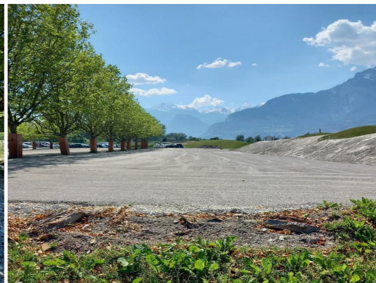
Rehaussement du coffre existant