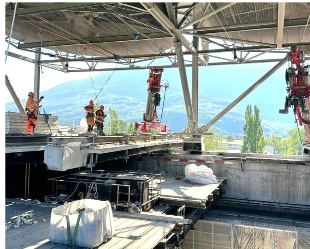
Démantèlement de l'ancienne toiture