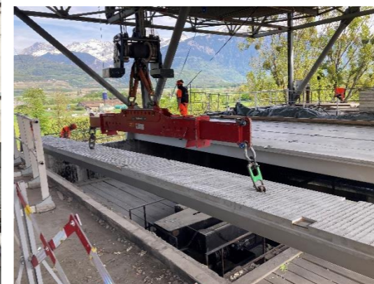
Montage des nouvelles poutres préfabriquées