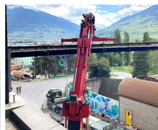
Vues d'ensemble de l'installation de chantier